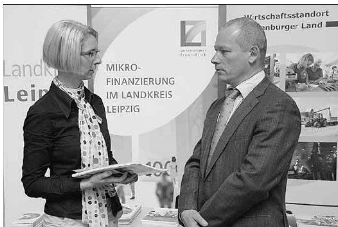
Gespräch am gemeinsamen Info-Stand der Landkreise Leipzig und Altenburger Land