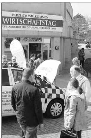
Eingang der Schnaudertalhalle in Meuschwitz