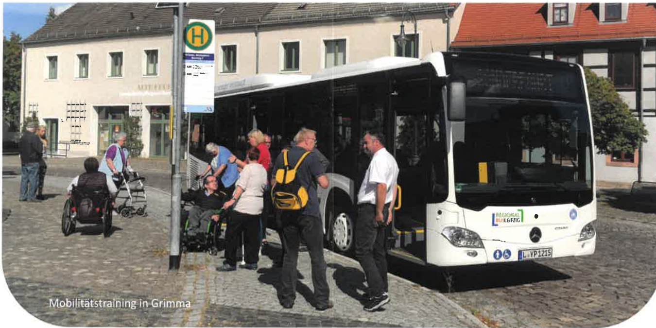
Mobilitätstraining in Grimma