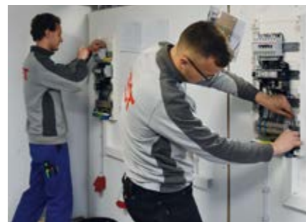
Zwei Azubis bereiten sich in der Lehrwerkstatt auf ihrer Gesellenprüfung vor.

Zudem nehmen wir auch im nächsten Jahr am 14.03.2024 wieder an den SCHAU-REIN! -Tagen teil.