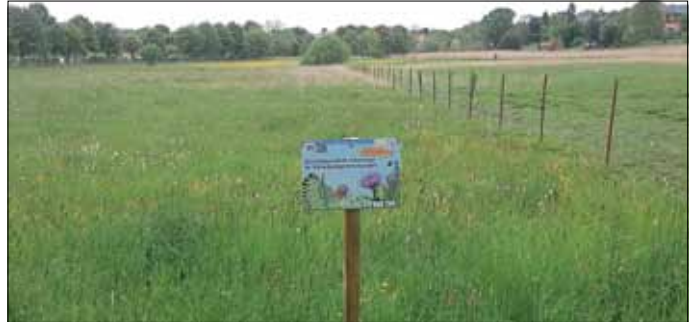
Fotoaufnahme von der „Schmetterlingswiese“ - Projekt 35 im Mai 2016

Ehrenamtlicher Naturschutzhelfer LK Leipzig